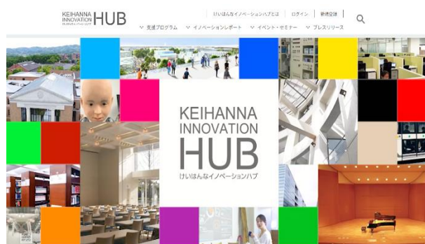
けいはんなイノベーションハブウェブサイト